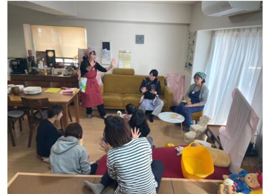
▲「鬼一のパンツはいいパンツ—強いぞ—強いぞー」歌って踊って、笑って、気分すっきり