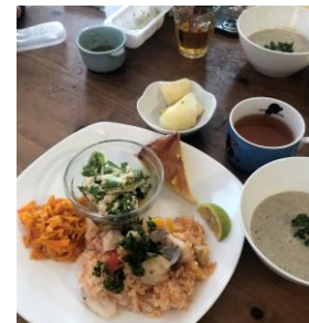
▲12月/魚介のピラフ/ゴボウの豆乳スープ/にんじんサラダ(ノンオイル)/豆腐と水菜のサラダ/簡単タルトタタン