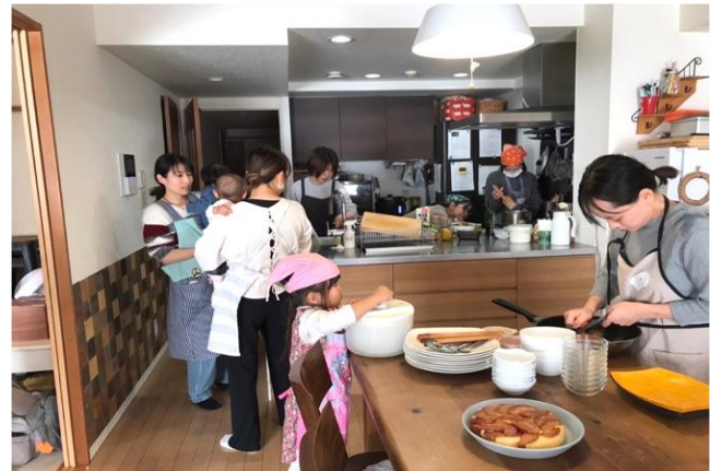
▲12月/「サラダの水切りはまかせて」子どもたちが調理に参加すると、もっとおいしくなるよ