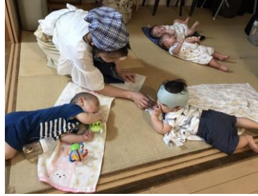
▲赤ちゃんたちはお互いに興味津々