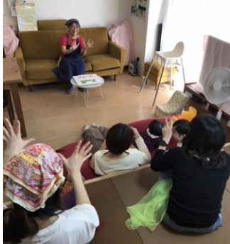
▲右手は関西式、左手は関東式で1、2の3、2の4の5、3、1、2の4の2の4の5...できる?