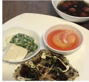
▲7月/玄米ごはんのお焼き(お好み焼き風)、モズクとトマトのスープ(白だし仕立て)水切り豆腐のオクラとろろかけ、すもものコンポート