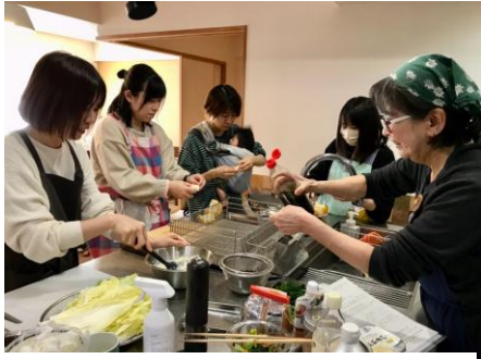
みんなで調理すると楽しい。力を合わせておいしいごはんを作るよ