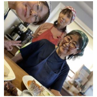
▲チームおうちカフェ最強のメンバー