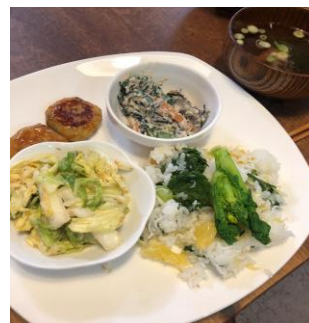
▲3月/菜の花寿司/白菜のゴマ味噌コールスロー/ひじきと青菜の白和え/とろろ昆布のすまし汁/芋もち