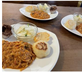
▲9月/サバ缶の腸活カレー/豆腐と米粉のクイックブレッド、梨とカブのサラダ、おから蒸しパン