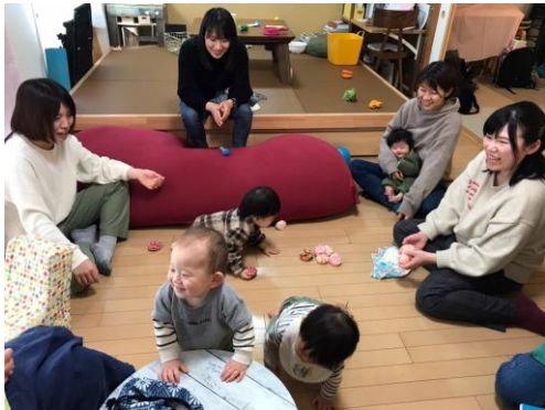
▲3月/お手玉を使ってわらべうた遊び。お手玉の名人はいなかったけど歌って遊んでいっぱい笑った