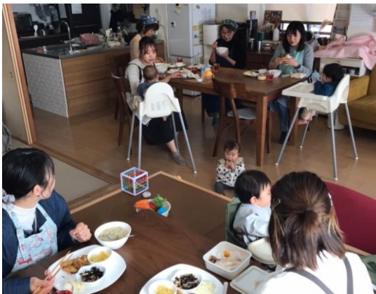
▲1月のおうちカフェ おいしいね、から生まれる会話と交流