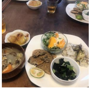
▲10月/青魚の利休焼き、サツマイモごはん、柿と春菊の塩麹豆腐サラダ、小松菜の海苔和え、根菜ときのこの味噌汁 リンゴの蒸し煮コンポート