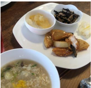
▲1月/山芋とろろのふわふわ雑炊、ブリと大根の香味甘酢炒め、ひじきレンコン、ゆず大根、水切り豆腐ヨーグルトの柚子ジャム添え