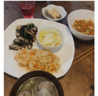
▲2月/にんじんごはん/イワシつみれの味噌汁、炒り豆腐焼き野菜のひじきサラダ、白菜のサラダ、黒ごま豆腐わらびもち