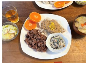
▲11月/小豆入り玄米ごはん、秋野菜の高野そぼろあんかけ、ひじきの白和え、白菜とリンゴのサラダ、サバ缶の船場汁、みかん