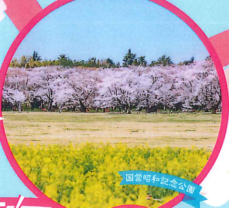
国営昭和記念公園