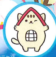
くにニャン 立川市観光まちづくり協会