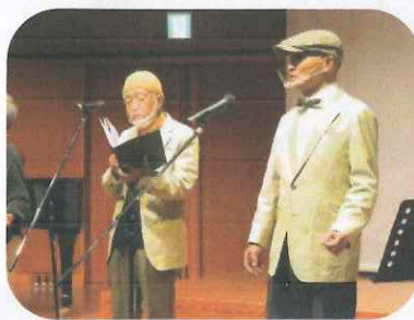
「AJET & OHIGE」 クリスマスバージョン