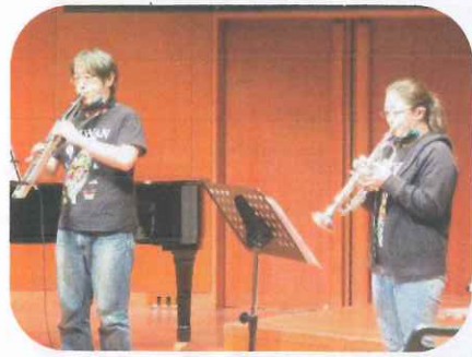
「寄せ鍋」のみなさん