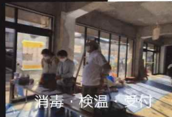
消毒・検温・受付