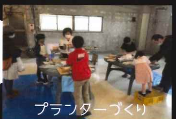
プランターづくり