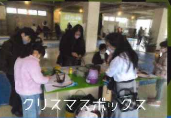
クリスマスボックス