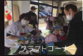
クラフトコーナー