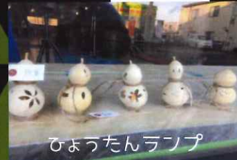
ひょうたんランプ