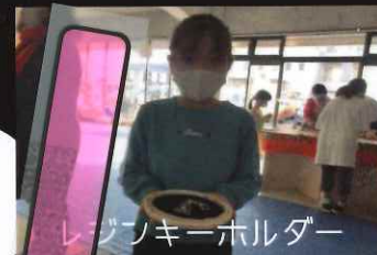
レジフキーホルダー