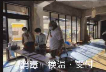
消毒・検温・受付