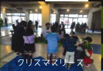
クリスマスリース