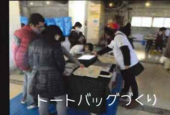
トートバッグづくり