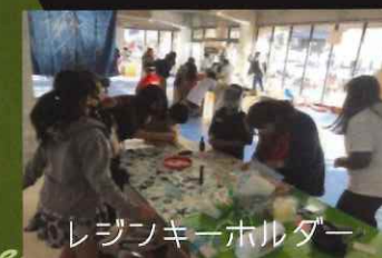
レジフキーホルダー