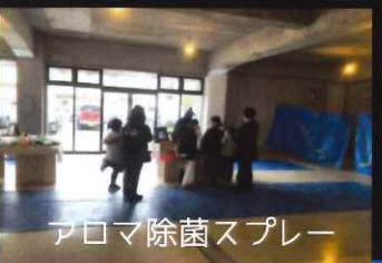
アロマ除菌スプレー