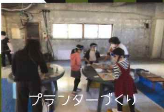
プランターづくり