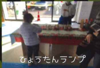
ひょうたんランプ