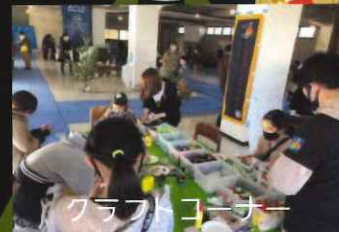
クラフトコーナー