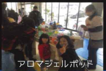
アロマジェルポッド