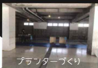
プランターづくり