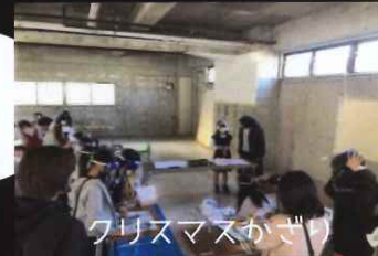
クリスマスかざり