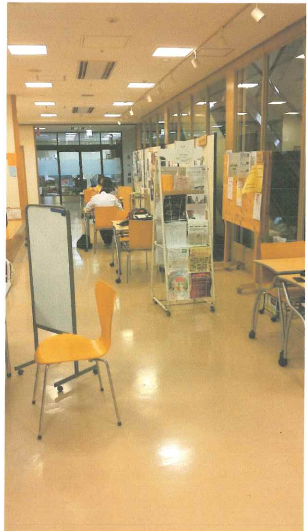
大津市市民センター 1階 打ち合わせルーム