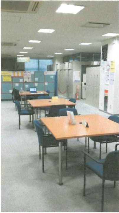
2F 会場 フロアー