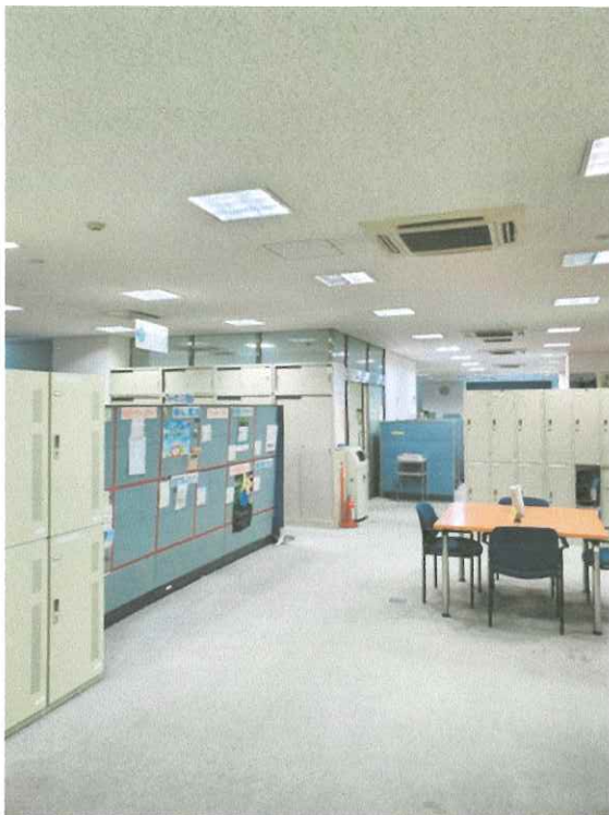
ひと まち交流館京都 2階ホール