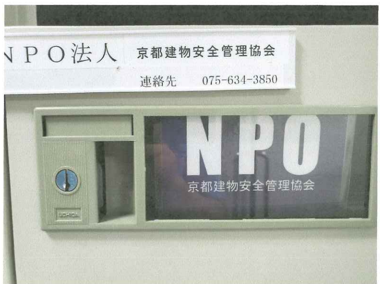
耐震相談受付申込み書 メールBOX