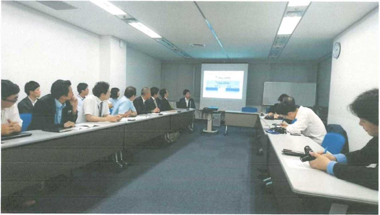
相談会打ち合わせ会議 2019.8月