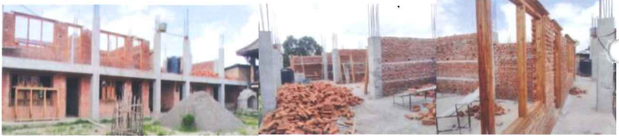
2019年末完成に向け工事が進む2階増築部分