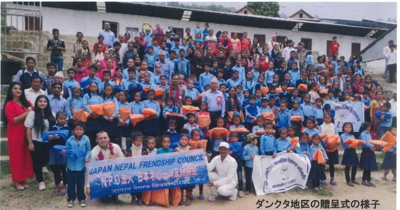
ダンクタ地区の贈呈式の様子