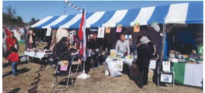
恒例の「国営昭和記念公園・緑の文化ゾーン」にて行われました、楽市に出店いたしました。

手作りのネパールのお茶「チャイ」は、毎年評判が良く楽しみに待っていただいているお客様がいます。天候にも恵まれ、チャイとバザーに出した品々も大変好評でした。売り上げは、全てネパールの子どもたちの教育支援に寄与いたします。