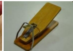
片手用爪切(タイプ2)

爪切りが固定された台に、手の平を乗せ軽く押すだけで、片手で爪を切ることが出来ます。