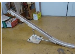
ポッチャーランプス

手の震えでカードが持てない人や、両手動作の出来ない人でも、カードを差込み固定すれば遊べます。