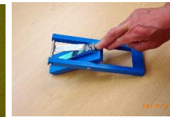
片手用爪切(タイプ1)

爪切りを台に固定しているので、爪切りを手で持たないで、手の平や、肘で押し爪を切ります。