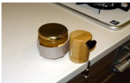
片手ピン蓋オープナー