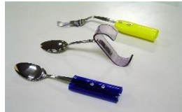
ホルダー付スプーン

握力が弱く、スプーン等が持てない人でも、柄を工夫し持ち易くしている(状態に合わせ種々あります)。