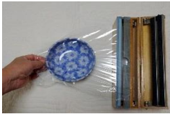
片手ラップカッター

ラップを引き出し、器にかけて右の蓋をしめ、上から押すことによりラップが容易に切れます。