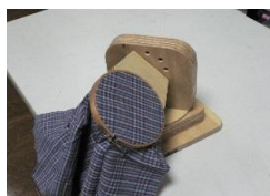
片手用刺しゅう枠