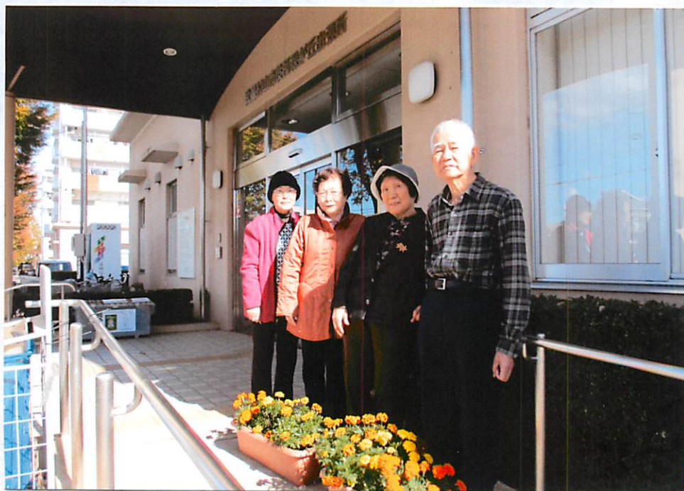
緑ヶ丘出張所・玄関のプランター手入れ