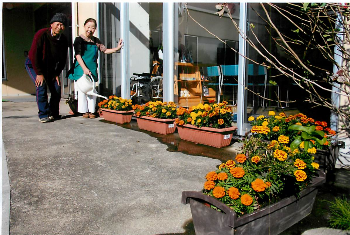
緑ヶ丘ふれあいセンター・玄関のプランター