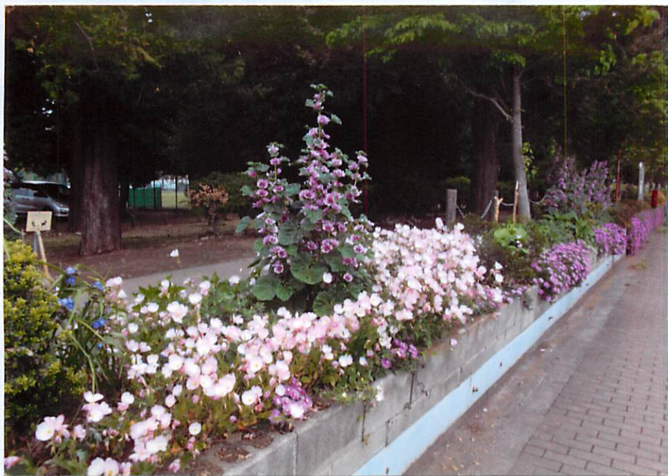
大南公園・東側・バス停南花壇