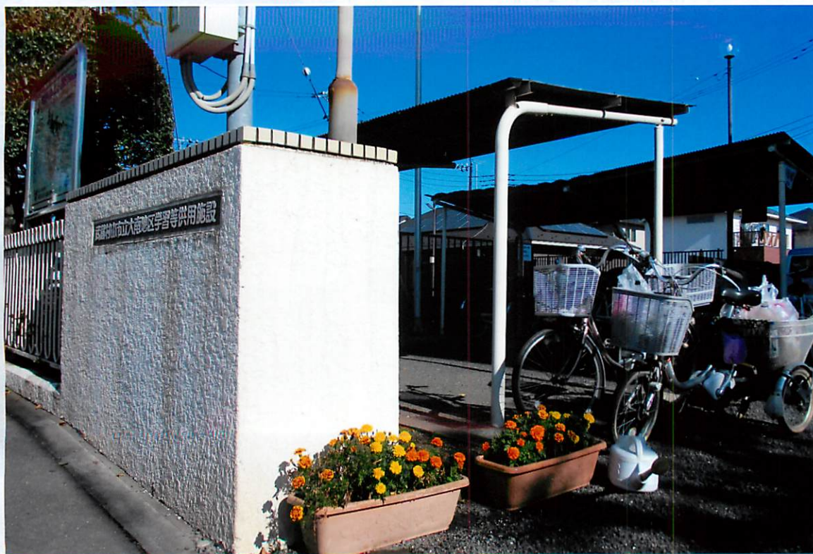
大南地区会館・入口のアplanター