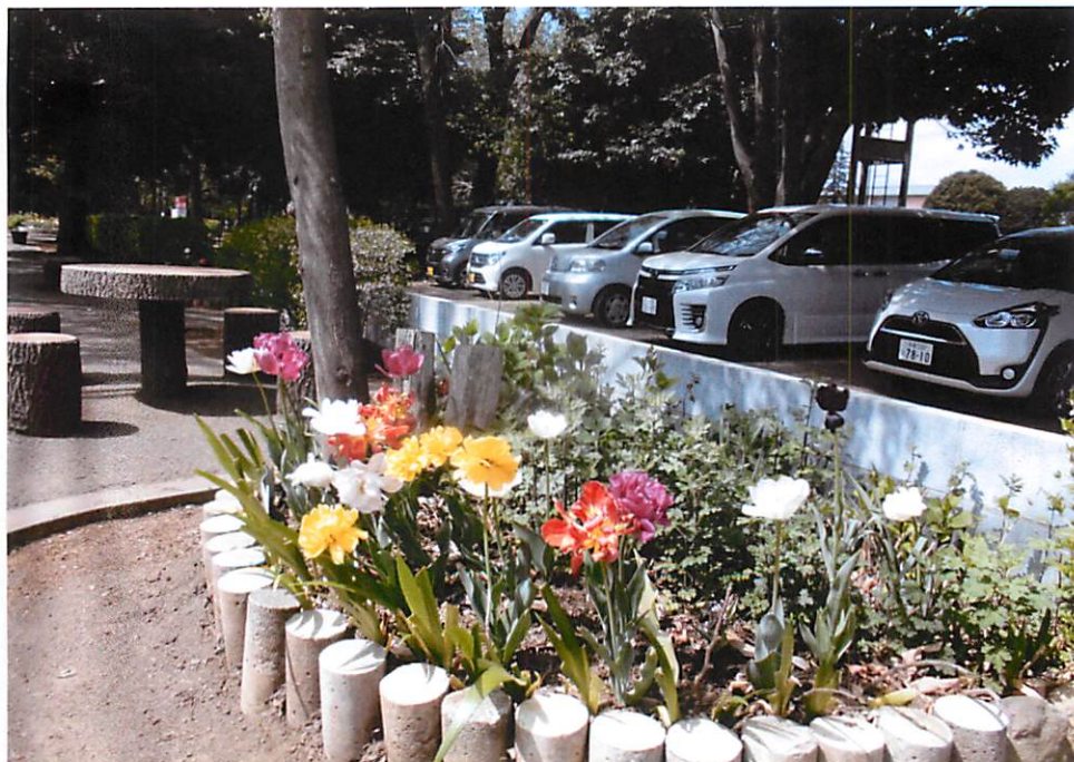
大南公園南側・歩道添いの新花壇