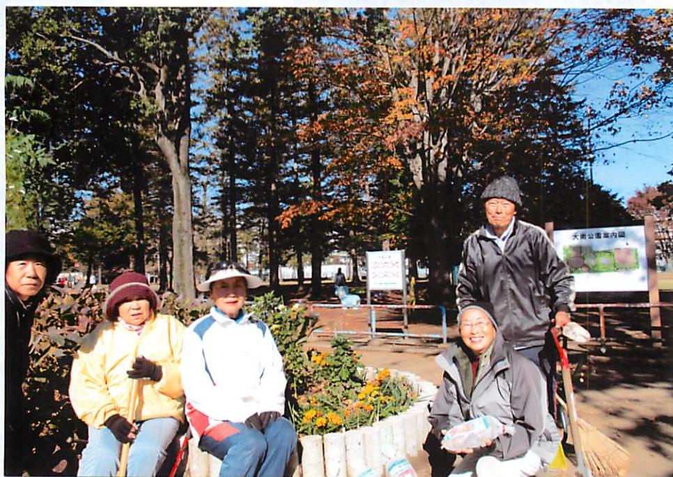
大南公園・南側入口の花壇