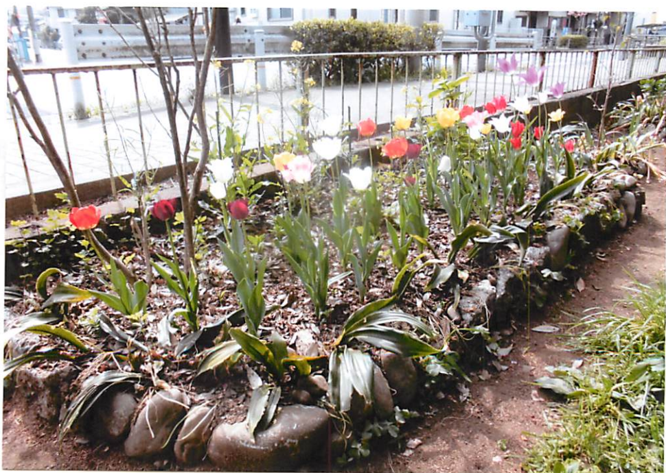
大南公園・東側の新花壇