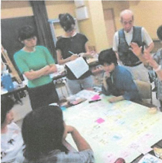
ワークショップの写真