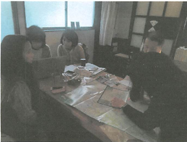
まちあるきの写真