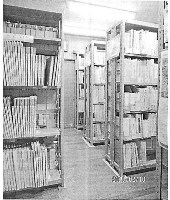
④資料センター書庫内風景